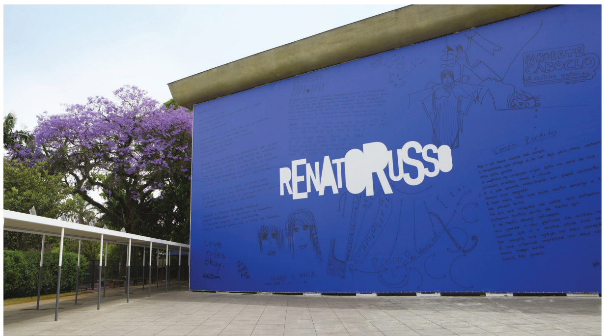
Figura 2 Outdoor da exposição “Renato Russo”, MIS-SP, 2017.

Era possível a leitura com clareza do logo de uma longa distância. Já os outros elementos, como os manuscritos e os desenhos, tiveram a sua legibilidade prejudicada em razão do contraste e das linhas finas. Porém, deve-se considerar que quanto mais próximo o visitante se encontrava da peça mais elementos eram revelados, o que se tornava um exercício prazeroso e interativo.