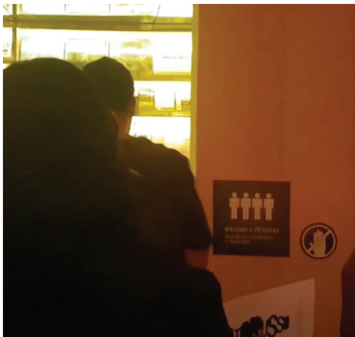
Figura 5 Sinalização desenvolvida pelo estúdio Lili Chiofalo, MIS-SP, 2017. Captura de tela adaptada de: https://www.youtube.com/watch?v=QQMRJgieEF4 . Acesso em 27/08/2020.

Uma peça gráfica que não se enquadra nos itens acima, embora também seja informativa e possua uma grande importância para narrativa, é a linha do tempo da vida de Renato Russo. Com uma estrutura próxima a dos textos de parede, nela existe uma clara alusão as ondas sonoras, aproveitando as modulações para criar um diagrama. Um diagrama é uma representação gráfica de estrutura, situação, ou, como neste caso, de processo, em que a informação não seria comunicada de forma tão eficiente se fosse feita de uma maneira convencional, como listas, por exemplo (Lupton & Phillips, 2008, p.199).