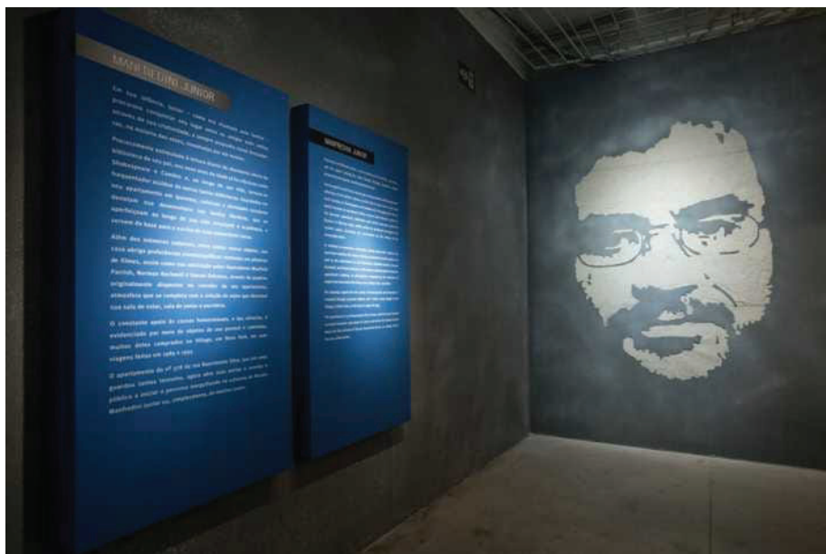
Figura 3 Texto de Grupo, “Renato Russo”, MIS-SP, 2017. Fonte: https://catracalivre.com.br/agenda/exposicao-no-mis-transporta-visitante-ao-universo-de-renato-russo/ . Acesso em 06/08/2020.

Segundo Screven (1992, p.184), as labels (Figura 4), ou etiquetas de identificação, se conectam diretamente ao objeto que o visitante olha em uma exposição, assim, a informação que consta na etiqueta deve ter um conteúdo desejado por esse observador. Para o autor, uma etiqueta tem como função atrair atenção, proporcionar escolhas, propor um recorte do tema da exposição, focar atenção nos objetos, elucidar possíveis curiosidades ou questões do visitante e comunicar mensagens. Elas são os menores itens do projeto gráfico, mas em maior número, além de serem as peças mais próximas aos objetos expostos.